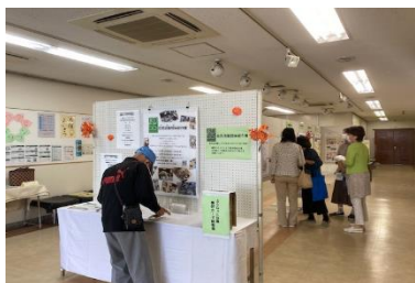
令和2年度 扶桑町中央公民館 にて

より多くの方に知っていただくため、今年度はイオンモール扶桑にて住民活動紹介展を行います。各団体のメンバーが作った思い溢れるポスターやパネルをご覧ください。