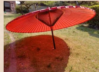
儀典用長柄端折傘(山那・尾関家)

昭和 27 年(1952)8 月 1 日をもって扶桑村は、扶桑町となりました。この年、柏森、高雄、山名の保育園が開設され、昭和 30 年(1955)には、端折傘が愛知県無形文化財に指定されています。昭和 34 年(1959)9 月 26 日には、伊勢湾台風襲来で東海地方が大被害を受け、扶桑町でも神社寺院の樹木倒壊をはじめ家屋にも甚大な被害がありました。その時の記憶が、脳裏に焼きついていいる人もおられることでしょう。自然災害の恐ろしさは、いつの世でも同じです。昭和 35 年(1960)に、高雄の消防 8 分団が統合され高雄分団に編成されました。この年、カラーテレビ放送が開始。昭和 39 年(1964)には、長泉塚古墳が、愛知県指定文化財となりました。昭和 47 年(1972)、町制 20 周年を迎え人口は 21,317 人、戸数は 5,061 戸。昭和 49 年(1974)、県立丹羽高等学校が開校しました。