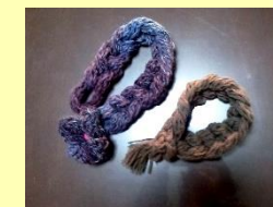
サロンで作ったマフラー

日時: 毎月第1木曜日 午前9:30~11:30 場所: 町内学習等供用施設 会費: 毎回100円