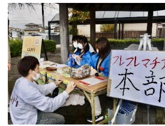
フルブレマチアルキ

名古屋経済大学の学生が扶桑町のイベントでボランティア活動を行いました。現場の動きに臨機応変に対応し、関係者と一緒にイベントを盛り上げました。