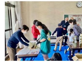
竹灯りワークショップ