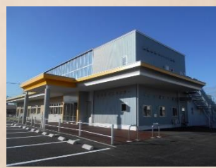
扶桑町児童センター(4/1 開館予定)

教育部には、保育園などを所管する「子ども課」、小中学校を担当する「学校教育課」が設けられます。この他、大半の課が新しい名称になり担当する業務も変わるそうです。まさに新扶桑町誕生です。祝!