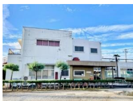
扶桑町いこいの家

新しい事務所はゆったりとおしゃべりするスペースや活動に使用できるお部屋もあります。ぜひご活用ください。