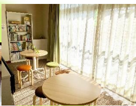
おしゃべりスペース