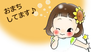
おまち しています♪