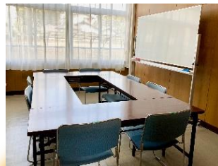
会議等の活動に利用できる ぶらんルーム(相談室)