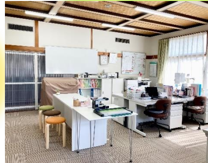
明るくゆったりとした空間