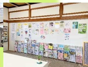
壁面全体が掲示板