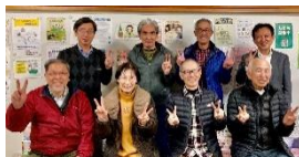
令和6年度実行委員の皆さん

令和9年には昭和35年4月～昭和38年3月生まれを対象に開催予定です。合わせて実行委員(対象年齢の方)を募集します。一緒に「65歳のつどい」を作り上げませんか？ご関心のある方はぶらねっと扶桑までお問合せください。